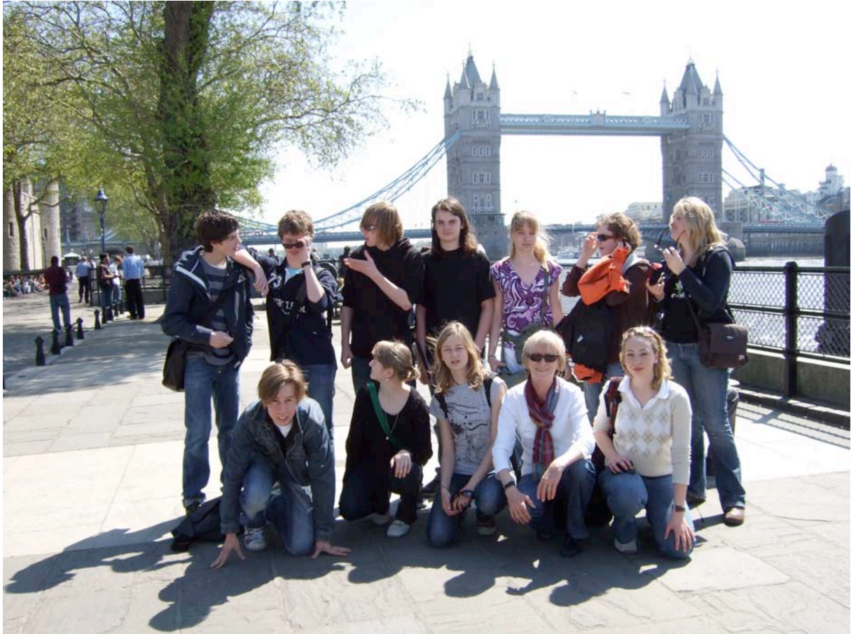
The happy group in London

Die großen Türme wirkten gigantisch, und bis auf „Wow“ oder „Boah“ brachte keiner von uns ein Wort heraus. Wir gingen über die wohl bekannteste Brücke der Welt, machten Fotos und Videos, alberten etwas herum, ließen uns den frischen Wind um die Nase wehen, blinzelten in die Sonne und breiteten die Arme über der Themse aus... Jeder wusste jetzt, dass dieser Austausch mit das Beste sein musste, was uns passieren konnte.